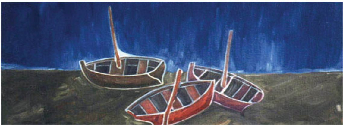
Arndt Tomás online since 1997 at http://www.worldpaintings.de