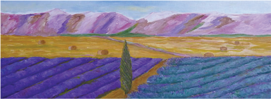
Landscapes from Europe, classical oil paintings, nude paintings and political artwork